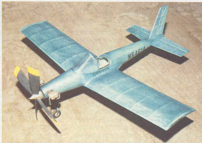
Oříšek Wind Wagon Zdeňka Cinerta z Kralup